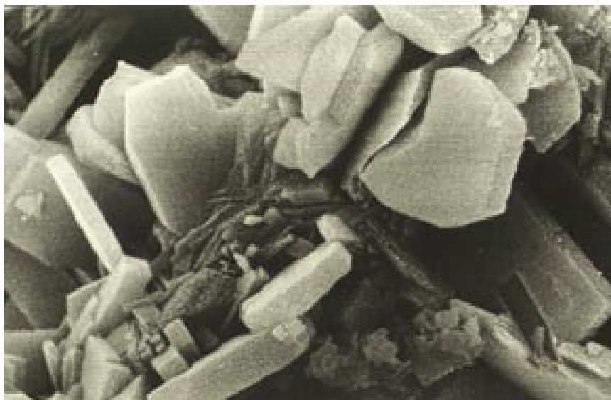
● Рис. 2. Электронная микрофотография кристаллов клиноптилолита (крупные пластины) в смеси с тонкими вкраплениями сопутствующих минералов

вился в Москву за американской визой, но – сюрприз! – посольство США ему отказало на том основании, что данная область знаний (нанотехнологии) находится под жестким контролем Госдепартамента. Оказалось, что для участия в подобной конференции надо было подавать заявку за месяц! В других случаях – на конференции по проблемам элементарных частиц, по ракетным делам и т. д. – визы выдавались в течение одного-двух дней.