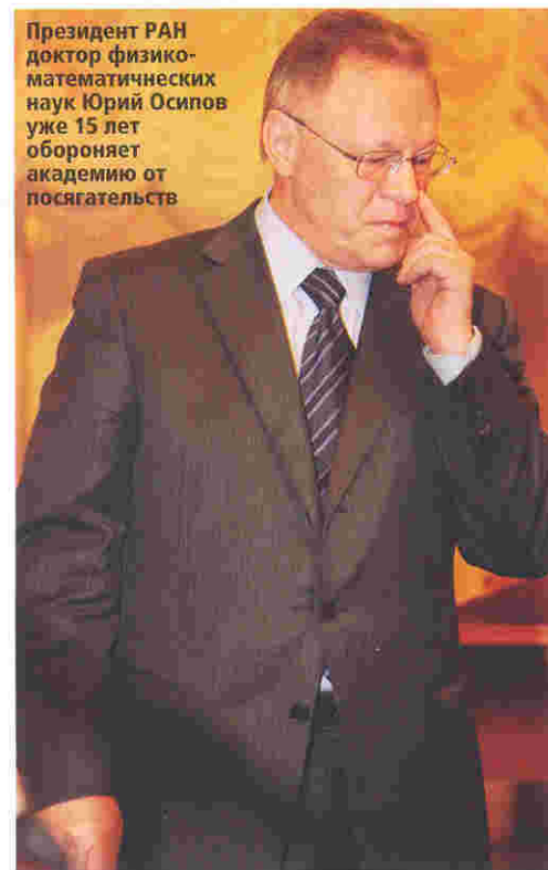
Президент РАН доктор физико-математических наук Юрий Осипов уже 15 лет обороняет академию от посягательств

Отдельная история с научными журналами. За рубежом они стоят дорого. Скажем, годовая подписка на англоязычную версию отечественного «Журнала экспериментальной и теорет-